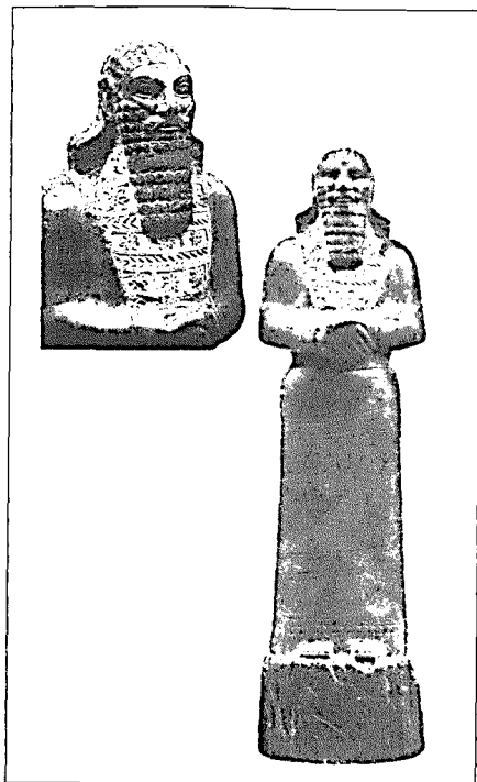
3 pav. Asirų karalius Ašurnasirpalas II (Ashur-nasir-apal II 883–859 m. pr. Kr.). Baltijos baseino gintaras (sukcinitas), aukštis 24,5 cm. Bostono vaizduoja- mojo meno muziejus, inv. 38.1396. Pagal A. Speke, 1956

Gintariniams asirų meno pavyzdžiams buvo priskiriama taip pat asirų karalių vaizduojanti skulptūrėlė, pagaminta tarp Adadnirari III (IX a. pr. Kr. antrasis ketvirtis) ir Tiglath-Pileser III (743–726 pr. Kr.) valdymo laikų (4 pav.) 67 . Šios skulptūrėlės stilistika, kaip ir radimo aplinkybės, yra visiškai neaiškūs. Be to, dar 1968 m. ši skulptūrėlė buvo ištirta IR metodu. Šia analize nustatyta, kad ji pagaminta iš iškastinių sakų randamų Artimuosiuose Rytuose, t. y. iš vadinamojo Libano gin-