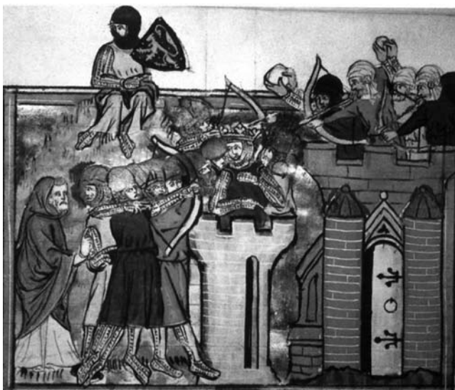
Ri ardas Li taširdis kovoja su musulmonais XII a. Pranc z miniati ra

lenk kronikininkas Janas Długoszas, aprašydamas Žalgirio m š ir jo kontekstus, Vokie i ordino vadovyb vaizdavo kaip išdidžius ir pasip tusius riterius, kurie kenkia lenk interesams (prisiminkime, kad Lenkijos karalius Kazimieras Didysis dar XIV a. su širdg la tur jo Vokie i ordinui perleisti nemaž Pamario dal , tas faktas neabejotinai l m ir neigiam Vokie i ordino vaizdavim XV a. ir v lesn je raštijoje). Ordinas buvo tapatinamas su vokie i tautyb s riteriais, o Sienkiewicziaus laikais tai buvo susieta su Antrojo Reicho didvalstybin mis ambicijomis. XIX a. viduryje ir XX a. pradžioje lenk inteligentija žvelg pavoj , vokie i imperijos keliam viltims atkurti Lenkijos nepriklausomyb . Lietuvi inteligentija šiuo atžvilgiu pritar kaimynams. Kita vertus, galvojant apie Lietuvos valstyb s atk rim , Kryžiaus kar epochoje vyk vokie i ir lietuvi susid rimai Durb s, Žalgirio (ir ne tik) laukuose, buvo perne lyg sureikšminti. Tiksliau tariant, kryžiuo i ir lietuvi kovas buvo naudinga pateikti XIX a. pabaigos – XX a. pirmosios pus s realij fone. 2