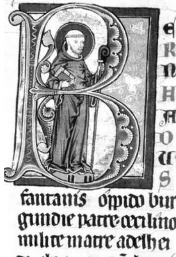
Šv. Bernardas Klervietis skelbia an- tr j Kryžiaus žyg . XII a. miniati ra

suvokti. Kita vertus, jei sutiksime su nuomone, kad keli kryžiaus žygiams atv r religinis fanatizmas, išeit , kad tarp XI a. pabaigos ir XIII a. antrosios pus s krikš ioniškoji Europa buvo tiesiog pamišusi, užvaldyta keistos aistros d l savo išganymo belstis kariauti tolimus kraštus. Ši visuome- n , jeigu tik sime XIX a. istorikais, pasidavusi fanatiškam pamokslinink šauksmui, mesdavo visus darbus, laiming gyvenim gimtuosiuose kraštuose, šeim , gimines, užsta- tydavo turt , išleisdavo daugyb pinig , kad gal t vykti kryžiaus žyg , kur patirdavo begal pavoj . Nejaugi krikš-