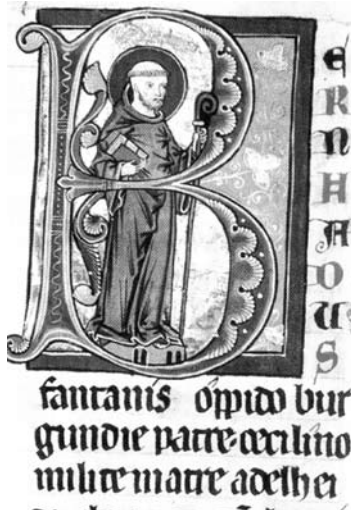
Šv. Bernardas Klervietis skelbia an- tr j Kryžiaus žyg . XII a. miniati ra

suvokti. Kita vertus, jei sutiksime su nuomone, kad keli kryžiaus žygiams atv r religinis fanatizmas, išeit , kad tarp XI a. pabaigos ir XIII a. antrosios pus s krikš ioniškoji Europa buvo tiesiog pamišusi, užvaldyta keistos aistros d l savo išganymo belstis kariauti tolimus kraštus. Ši visuome- n , jeigu tik sime XIX a. istorikais, pasidavusi fanatiškam pamokslinink šauksmui, mesdavo visus darbus, laiming gyvenim gimtuosiuose kraštuose, šeim , gimines, užsta- tydavo turt , išleisdavo daugyb pinig , kad gal t vykti kryžiaus žyg , kur patirdavo begal pavoj . Nejaugi krikš-